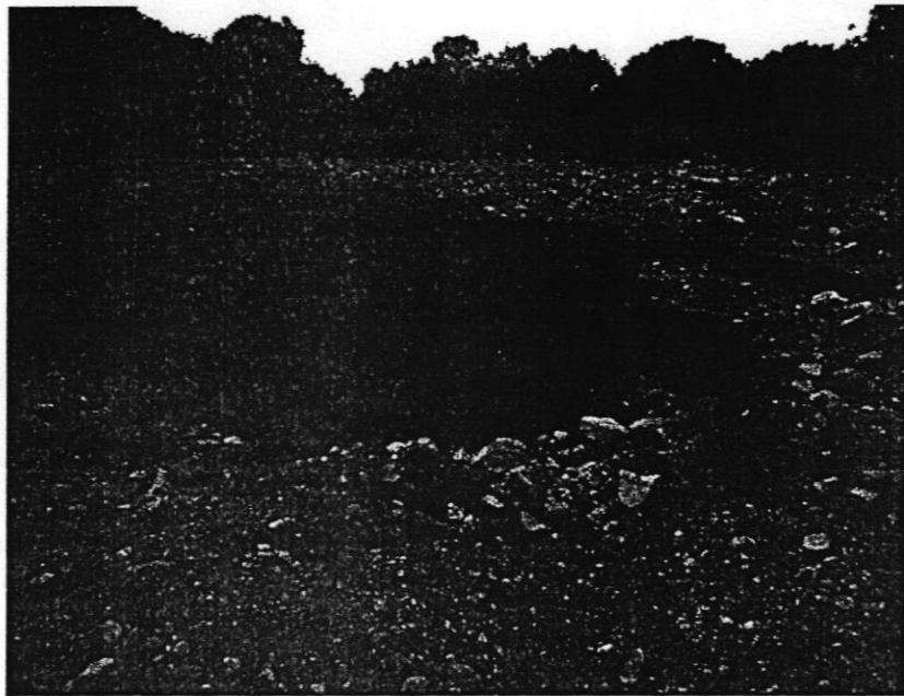
Hồ lún sụt xuất hiện gần khu dân cư ở Uông Bí.

Nhiều hộ dân tại tổ 2, khu 10, phường Thanh Sơn (TP Uông Bí) gửi đơn kiến nghị đến báo Nông nghiệp Việt Nam, phản ánh việc Cty CP Xí nghiệp than Uông Bí, thường xuyên nổ mìn vào đêm và sáng, gây ảnh hưởng tồi tệ đến cuộc sống của cư dân.