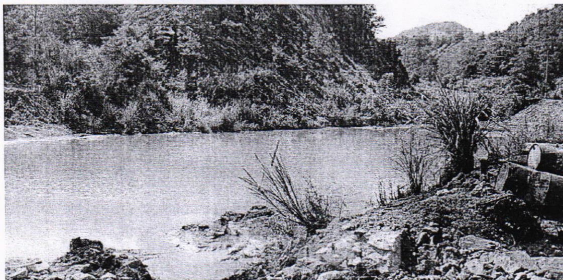
Dòng suối Lại bỗng nhiên đổi màu vàng đục bốc mùi tanh nồng từ đầu năm 2018.

Nhiều ngày nay, Tiền Phong liên tục nhận được đơn thư của người dân sống tại phường Hà Khánh, TP Hạ Long (Quảng Ninh) phản ánh việc dòng suối Lại trở nên vàng khè, bốc mùi tanh nồng, chảy từ khu vực khai trường Bắc Bàng Danh của Cty than Hòn Gai - Tập đoàn Than, Khoáng sản Việt Nam, đổ thẳng vào vịnh Hạ Long.