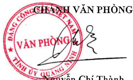
Nguyễn Chí Thành